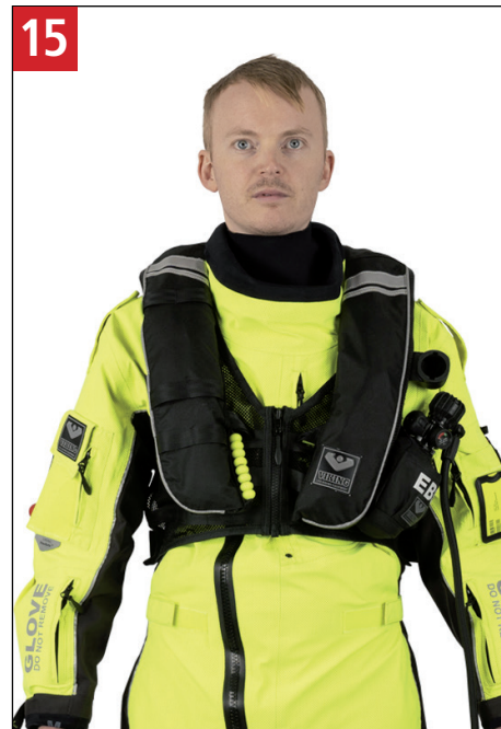
15 Efter opstigning til overfladen, lad mundstykket falde langs kroppen. After surfacing, let the mouth piece fall along the body.