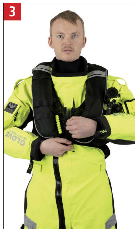
3 Lyn lynlås. Close zipper.