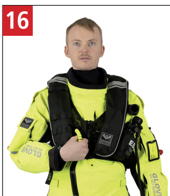
16 Efter opstigning til overfladen, løsn håndtag i højre side for oppustning af vesten. After surfacing, pull the handle to inflate the lifejacket in the right side.