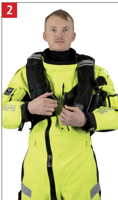
2 Luk spændet. Close the buckle.