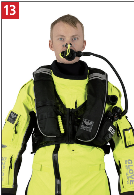
13 Sæt næseklemmen på og træk vejret roligt. Put on the nose clip and breathe calmly.