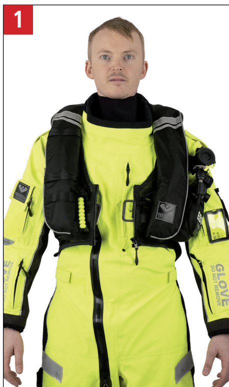
1 Tag højre og venstre arm gennem armhuller. Put left and right arms through armholes.