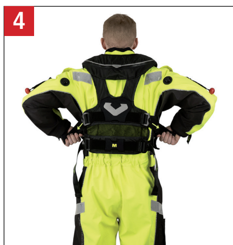
4 Juster øverste gjord. Adjust upper strap securely to fit lifejacket around torso.