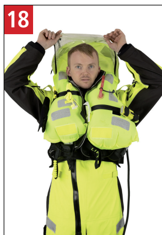
18 I overfladen anlægges sprayhood. Pull down the spray hood after surfacing.