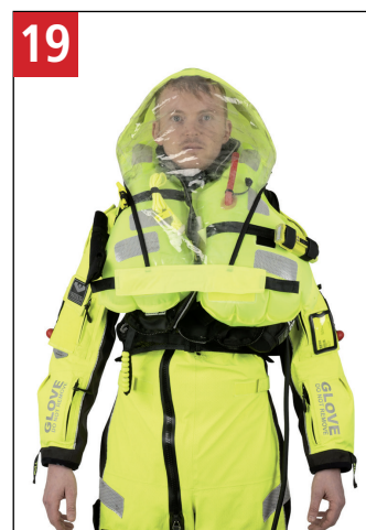
19 Korrekt påtaget redningsvest. Correct donning of lifejacket.