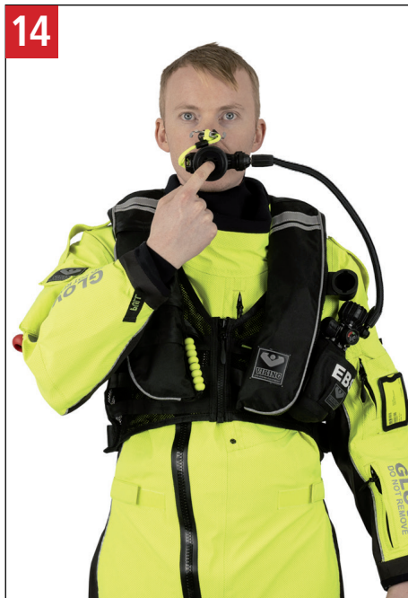
14 Tryk på udluftningsknappen på forsiden af mundstykket for at fjerne vand fanget inde i regulatoren. Press the purge button on the front of the mouthpiece to expel any water trapped inside the regulator.