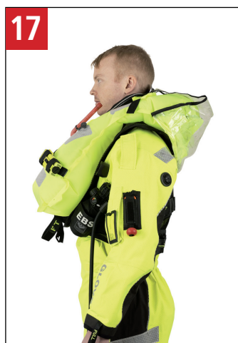
17 Udløst redningsvest. Inflated lifejacket.