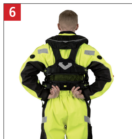
6 Fastgør gjorde bag på redningsvesten. Fasten the straps to the back of the lifejacket.